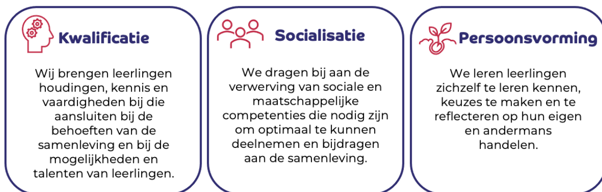
Afbeelding 1. Maatschappelijke opdracht CVO Groep